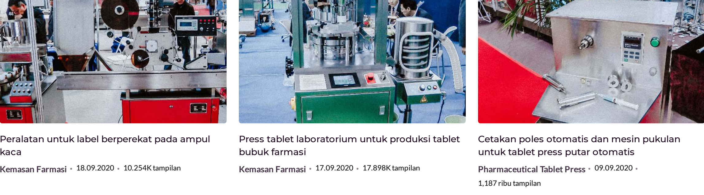
Peralatan untuk label berperekat pada ampul kaca Kemasan Farmasi · 18.09.2020 · 10.254K tampilan