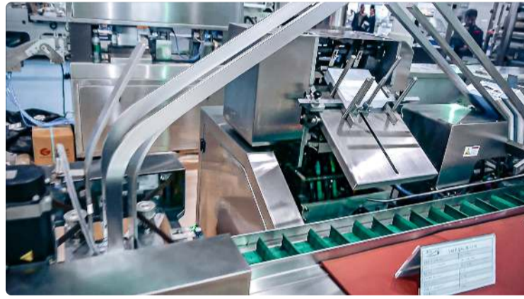
Peralatan otomatis untuk mengisi lepuh di kotak karton Pharmaceutical Tablet Press · 20.11.2020 · 77.100K tampilan