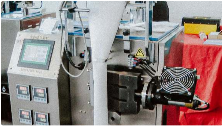
Mesin pengemas otomatis untuk mengemas bubuk dan butiran menjadi bahan filter tas... Pharmaceutical Tablet Press · 11.09.2020 · 1.550K tampilan