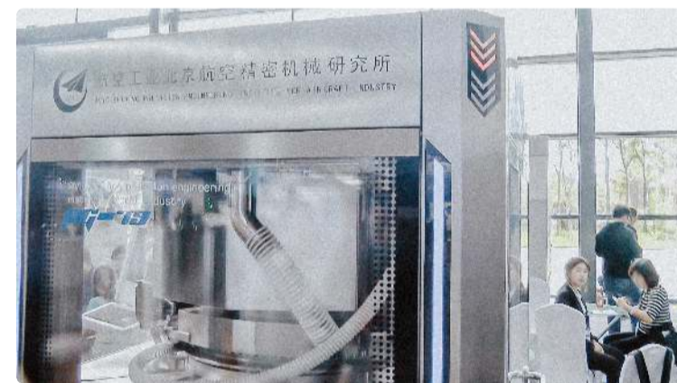
Produksi tablet kecepatan tinggi rotary tablet press otomatis Pharmaceutical Tablet Press - 02.09.2020 - 1.100K tampilan