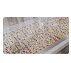
SBLM Peralatan pengepakan blister otomatis berkecepatan tinggi untuk pengepakan blister dengan kapsul gelatin keras Pharmaceutical Tablet Press - 14.09.2020