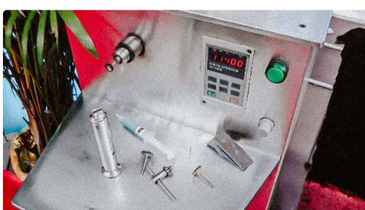
Memoles permukaan logam pada punch dan matrix untuk menekan tablet Pharmaceutical Tablet Press · 09.09.2020 · 1.555K tampilan