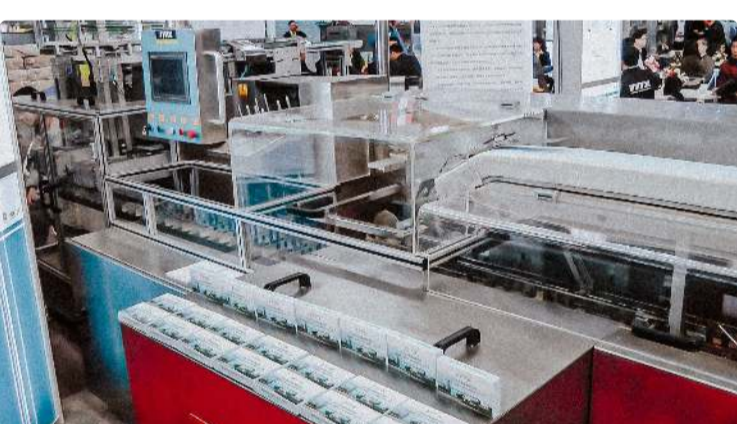
Mesin karton otomatis untuk kemasan lecek dengan tablet dalam kotak karton Pharmaceutical Tablet Press · 09.09.2020 · 997 tampilan