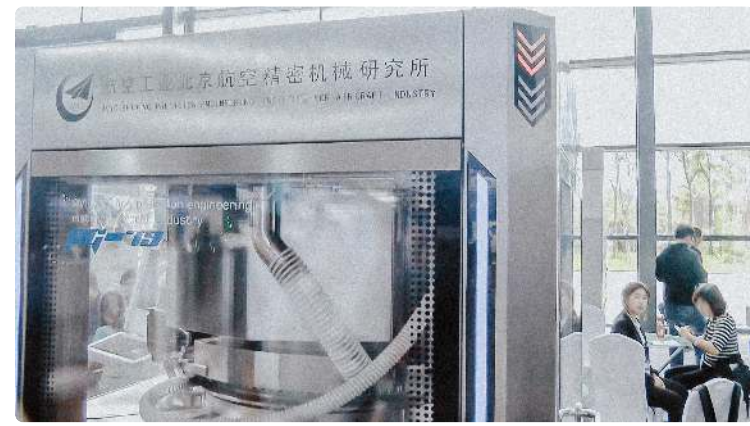
Produksi tablet kecepatan tinggi rotary tablet press otomatis Pharmaceutical Tablet Press • 02.09.2020 • 1.100K tampilan