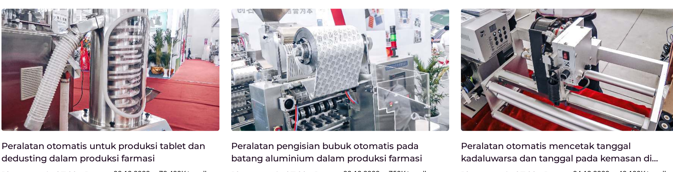
Peralatan otomatis untuk produksi tablet dan dedusting dalam produksi farmasi Peralatan pengisian bubuk otomatis pada batang aluminium dalam produksi farmasi Peralatan otomatis mencetak tanggal kadaluwarsa dan tanggal pada kemasan di...