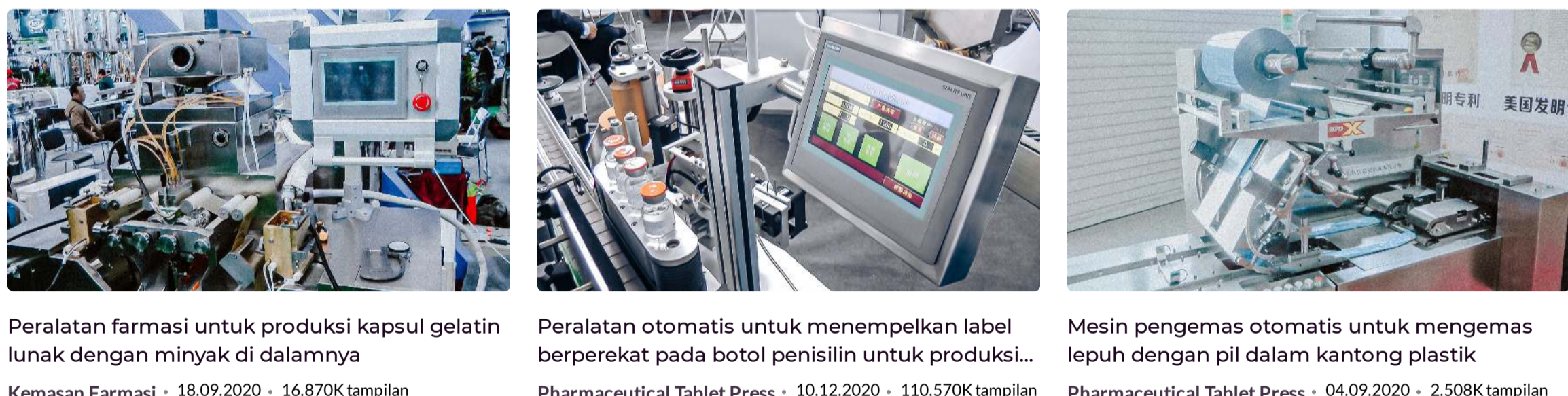
Peralatan farmasi untuk produksi kapsul gelatin lunak dengan minyak di dalamnya Kemasan Farmasi · 18.09.2020 · 16.870K tampilan Peralatan otomatis untuk menempelkan label berperekat pada botol penisilin untuk produksi... Pharmaceutical Tablet Press · 10.12.2020 · 110.570K tampilan Mesin pengemas otomatis untuk mengemas lepuh dengan pil dalam kantong plastik Pharmaceutical Tablet Press · 04.09.2020 · 2.508K tampilan