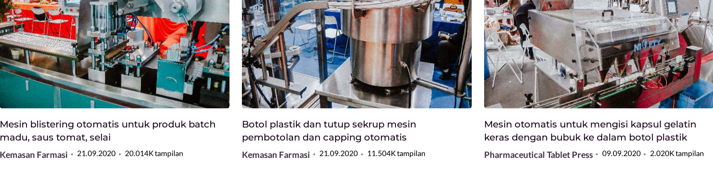
Mesin blistering otomatis untuk produk batch madu, saus tomat, selai; Botol plastik dan tutup sekrup mesin pembotolan dan capping otomatis; Mesin otomatis untuk mengisi kapsul gelatin keras dengan bubuk ke dalam botol plastik