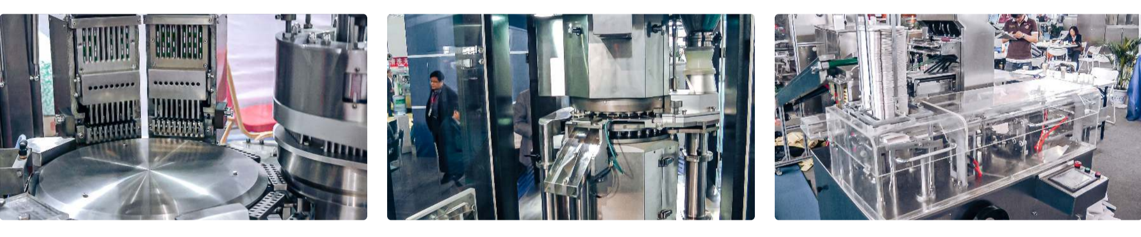
Peralatan otomatis untuk mengisi kapsul gelatin keras dengan butiran Finlandia Pharmaceutical Tablet Press · 04.11.2020 · 78.401K tampilan Peralatan otomatis untuk pengepresan dan produksi pil dalam produksi farmasi Pharmaceutical Tablet Press · 10.12.2020 · 110.570K tampilan Peralatan otomatis Mesin karton produksi farmasi Kanada Pharmaceutical Tablet Press · 02.12.2020 · 55.400K tampilan