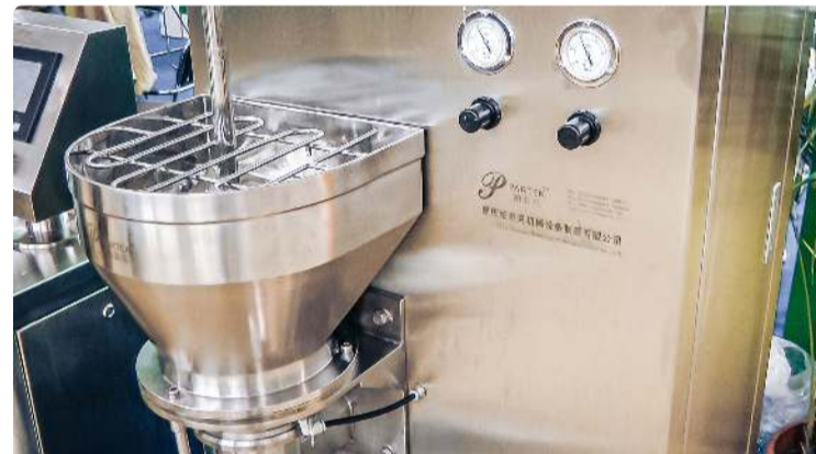
Peralatan pelet bubuk otomatis untuk produksi farmasi Pharmaceutical Tablet Press · 30.11.2020 · 97.489K tampilan