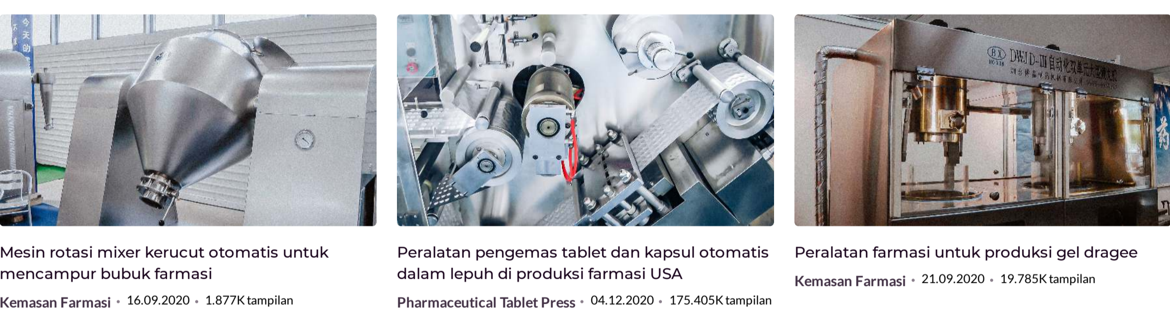
Mesin rotasi mixer kerucut otomatis untuk mencampur bubuk farmasi Peralatan pengemas tablet dan kapsul otomatis dalam lepuh di produksi farmasi USA Peralatan farmasi untuk produksi gel dragee