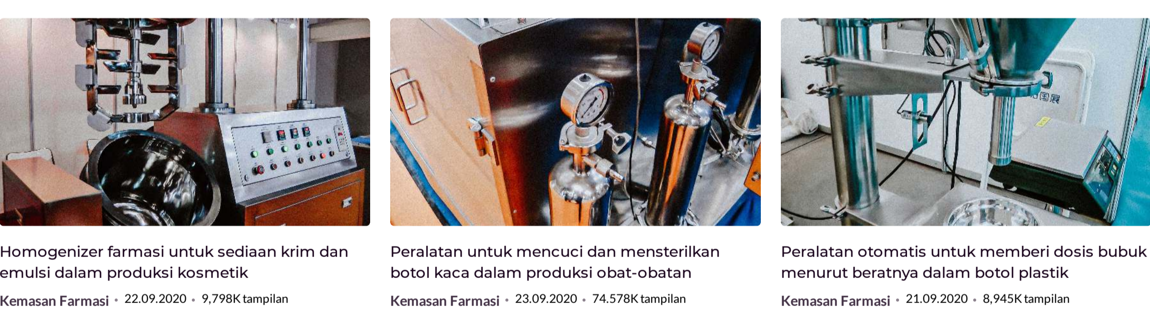
Homogenizer farmasi untuk sediaan krim dan emulsi dalam produksi kosmetik Kemasan Farmasi · 22.09.2020 · 9,798K tampilan