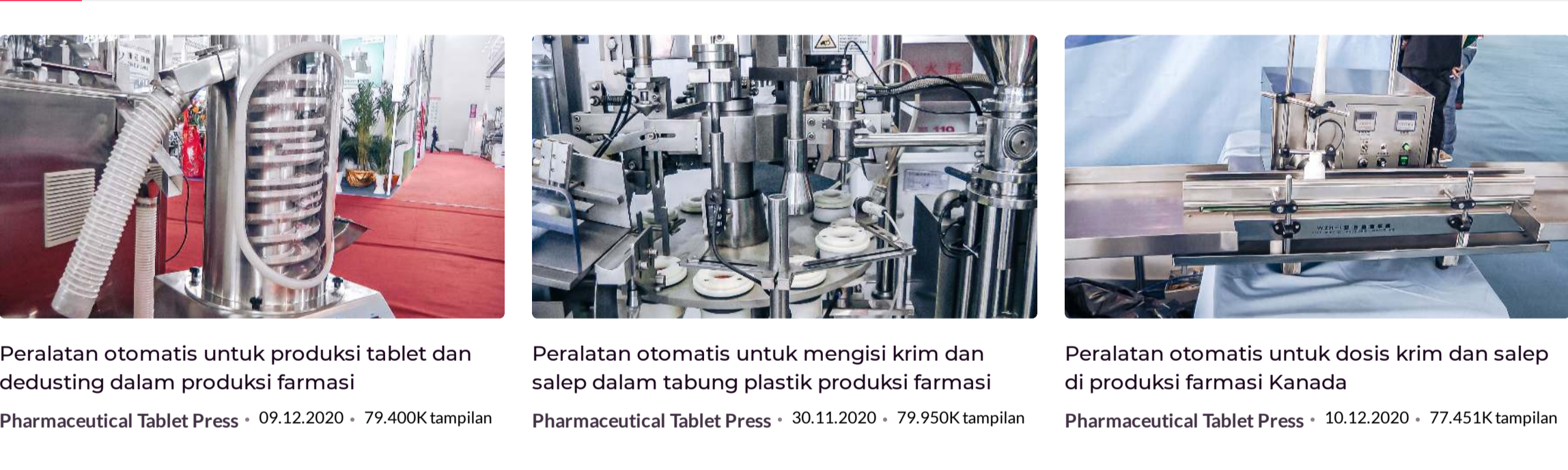
Peralatan otomatis untuk produksi tablet dan dedusting dalam produksi farmasi (94.100K tampilan) | Peralatan otomatis untuk mengisi dan salep dalam tabung plastik produksi farmasi (79.950K tampilan) | Peralatan otomatis untuk dosis krim dan salep di produksi farmasi Kanada (77.451K tampilan)