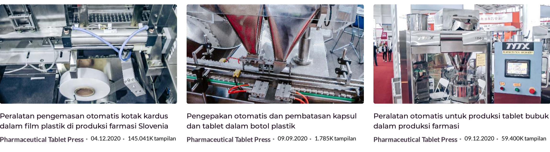
Peralatan pengemasan otomatis kotak kardus dalam film plastik di produksi farmasi Slovenia Pengepakan otomatis dan pembatasan kapsul dan tablet dalam botol plastik Peralatan otomatis untuk produksi tablet bubuk dalam produksi farmasi