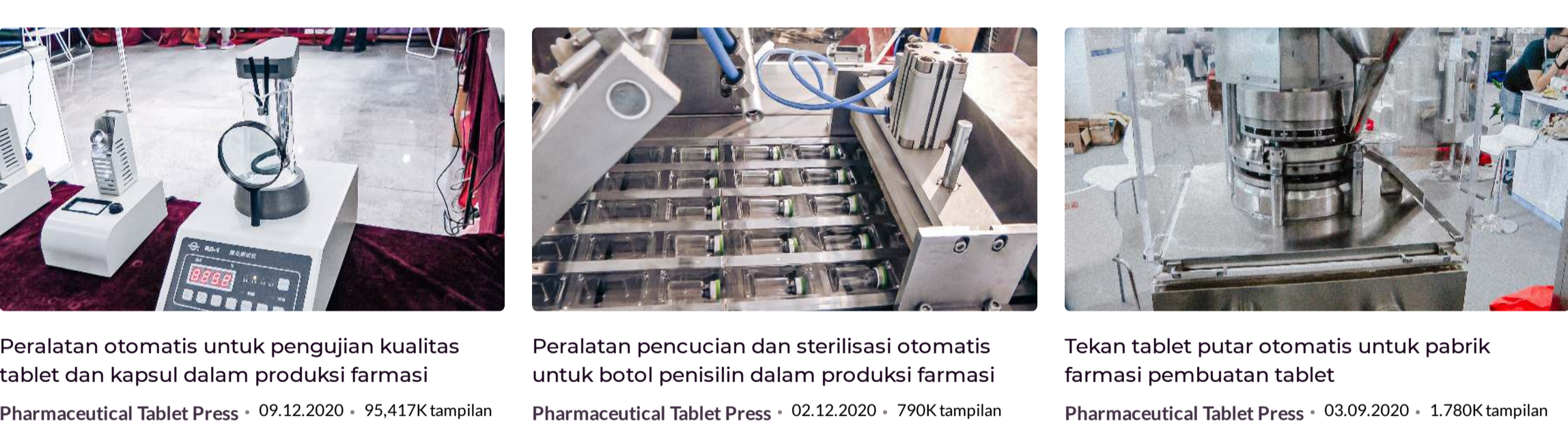
Peralatan otomatis untuk pengujian kualitas tablet dan kapsul dalam produksi farmasi Pharmaceutical Tablet Press • 09.12.2020 • 95,417K tampilan