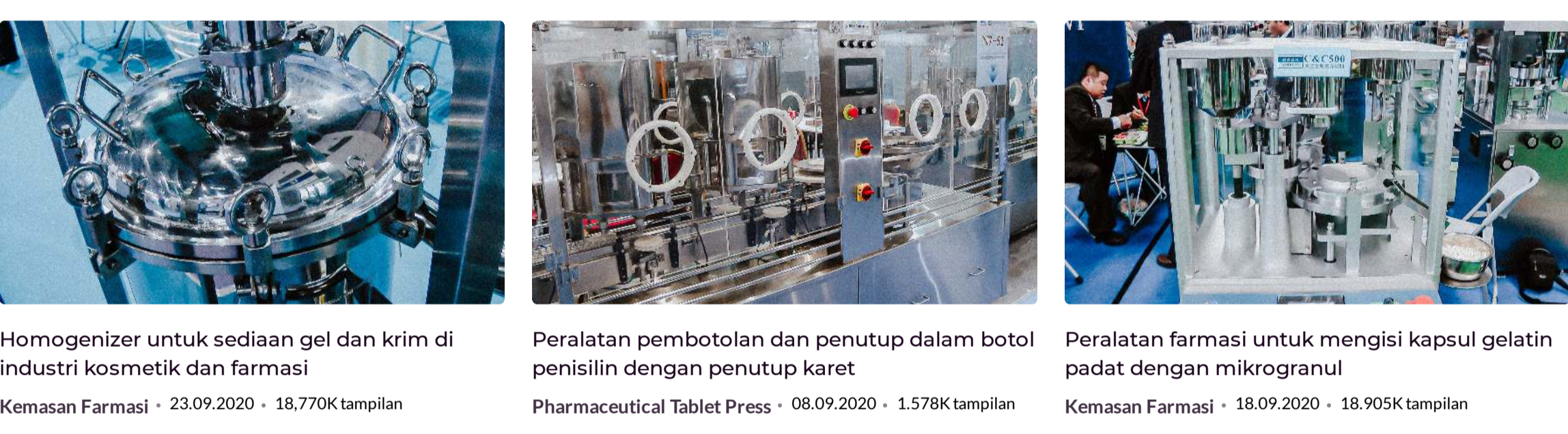
Homogenizer untuk sediaan gel dan krim di industri kosmetik dan farmasi Kemasan Farmasi · 23.09.2020 · 18.770K tampilan Peralatan pembotolan dan penutup dalam botol penisilin dengan penutup karet Pharmaceutical Tablet Press · 08.09.2020 · 1.578K tampilan Peralatan farmasi untuk mengisi kapsul gelatin padat dengan mikrogranul Kemasan Farmasi · 18.09.2020 · 18.905K tampilan