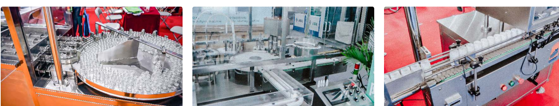
Peralatan otomatis untuk mencuci dan sterilisasi botol penisilin Mesin pengisi dan penutup botol penisilin dengan tutup plastik untuk cairan Mesin pengisian dan pengisian otomatis dalam botol plastik kapsul gelatin keras