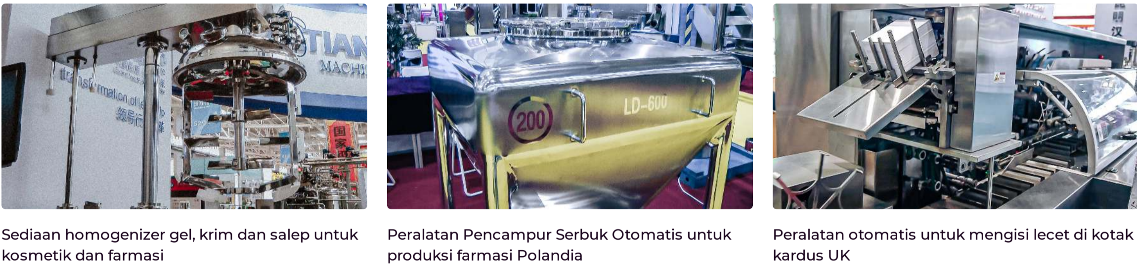
Sediaan homogenizer gel, krim dan salep untuk kosmetik dan farmasi Peralatan Pencampur Serbuk Otomatis untuk produksi farmasi Polandia Peralatan otomatis untuk mengisi lecek di kotak kardus UK