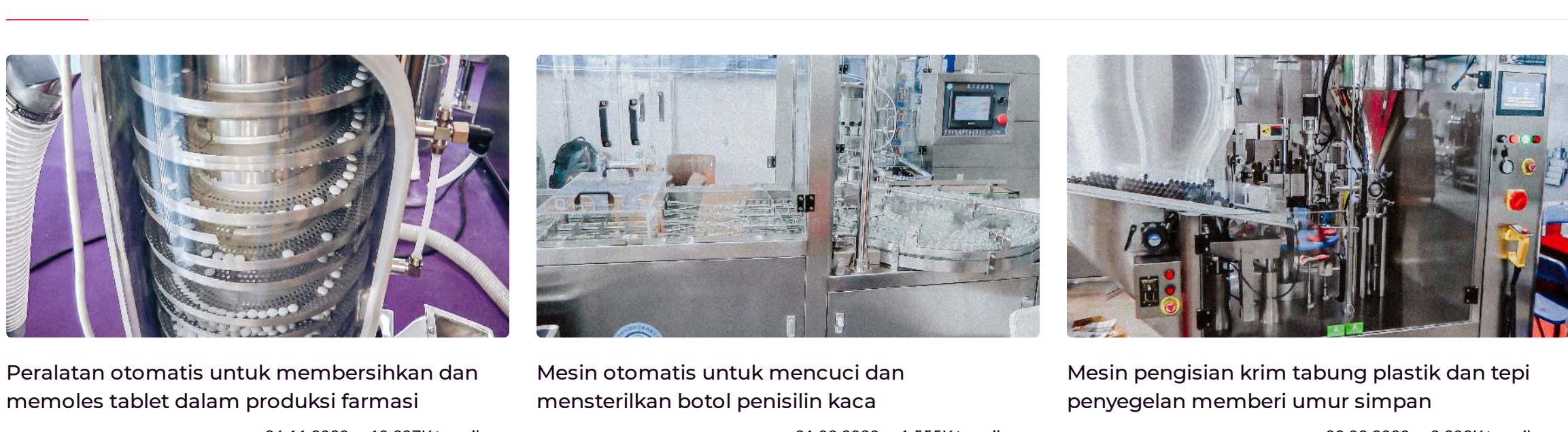
Peralatan otomatis untuk membersihkan dan memoles tablet dalam produksi farmasi Mesin otomatis untuk mencuci dan mensterilkan botol penisilin kaca Mesin pengisian krim tabung plastik dan tepi penyegelannya memberi umur simpan