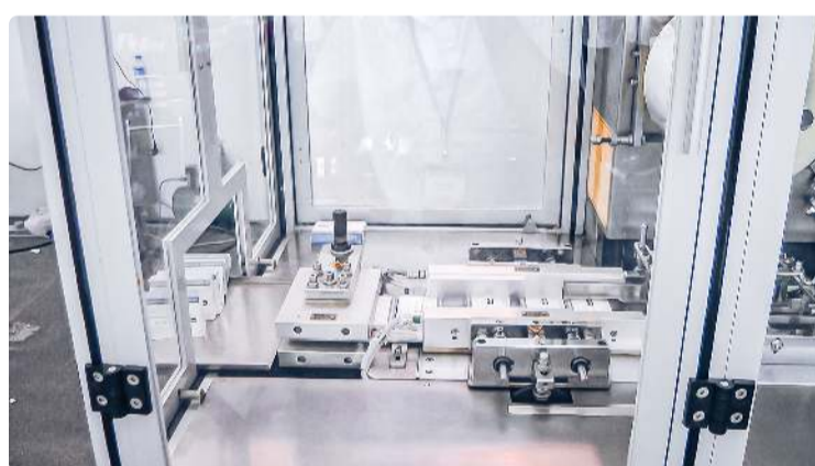
Peralatan pengemasan karton plastik otomatis dalam produksi farmasi Pharmaceutical Tablet Press · 07.12.2020 · 459K tampilan