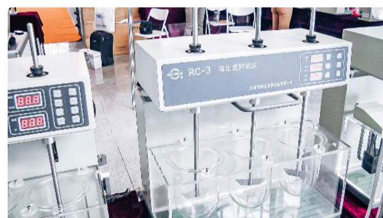
Peralatan otomatis untuk pengujian kualitas tablet dan kapsul dalam produksi farmasi... Pharmaceutical Tablet Press · 09.12.2020 · 79.401K tampilan