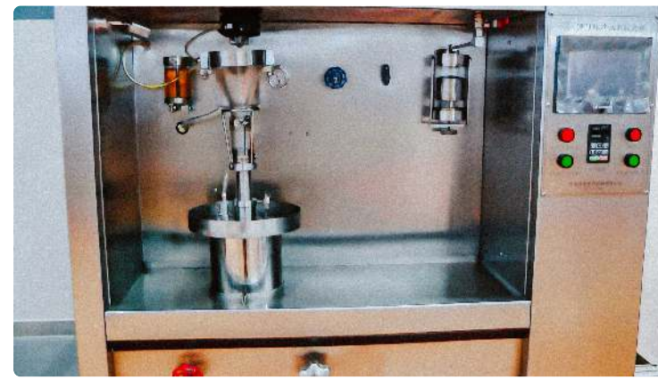
Peralatan untuk produksi kapsul gel dengan minyak dalam produksi obat-obatan Kemasan Farmasi · 23.09.2020 · 99.780K tampilan