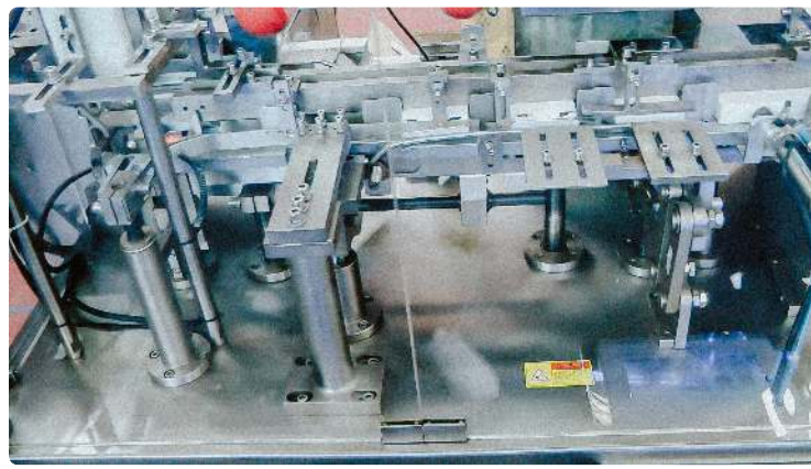
Peralatan pembuatan karton otomatis untuk kemasan produk individu dalam kotak Pharmaceutical Tablet Press · 11.09.2020 · 1.457 ribu tampilan