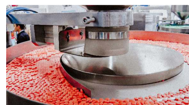
Mesin blister otomatis berkecepatan tinggi untuk tablet di lepuh Alu / Alu Kemasan Farmasi · 24.09.2020 · 985K tampilan