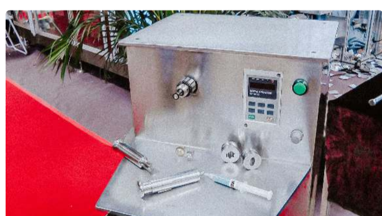
Cetakan poles otomatis dan mesin pukulan untuk tablet press putar otomatis Pharmaceutical Tablet Press · 09.09.2020 · 1.187 ribu tampilan