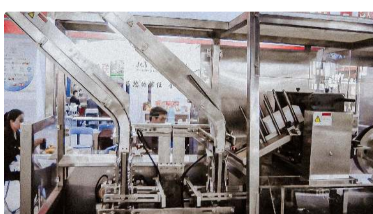
Peralatan karton otomatis untuk mengemas blister dan produk ke dalam kotak Pharmaceutical Tablet Press · 14.09.2020 · 1.225K tampilan