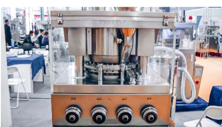
Peralatan otomatis untuk produksi dan pengepresan tablet dalam produksi farmasi Pharmaceutical Tablet Press · 10.12.2020 · 70.410K tampilan