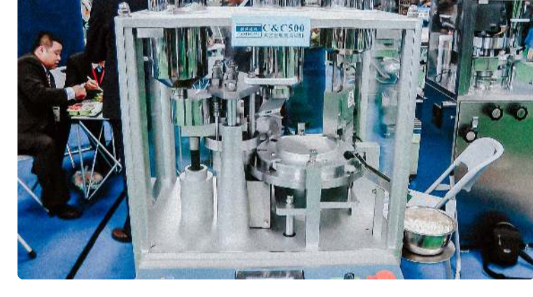
Farmasøytisk utstyr for å fylle faste gelatinkapsler med mikrogranuler Farmasøytisk emballasje · 18.09.2020 · 18.905K utsikt