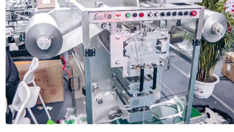
Automatisk utstyr til tablettemballasje i aluminiumsfolie i farmasøytisk produksjon Farmasøytisk tablettpresse · 04.12.2020 · 45.700K utsikt