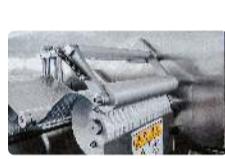
NESTE Automatisk blisteremballasjemaskin for tabletter og gelatinkapsler i blisterpakninger Farmasøytisk emballasje · 18.09.2020