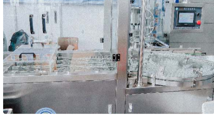
Automatisk maskin for vasking og sterilisering av penicillinflasker av glass Farmasøytisk tablettpresse · 01.09.2020 · 1.555K utsikt