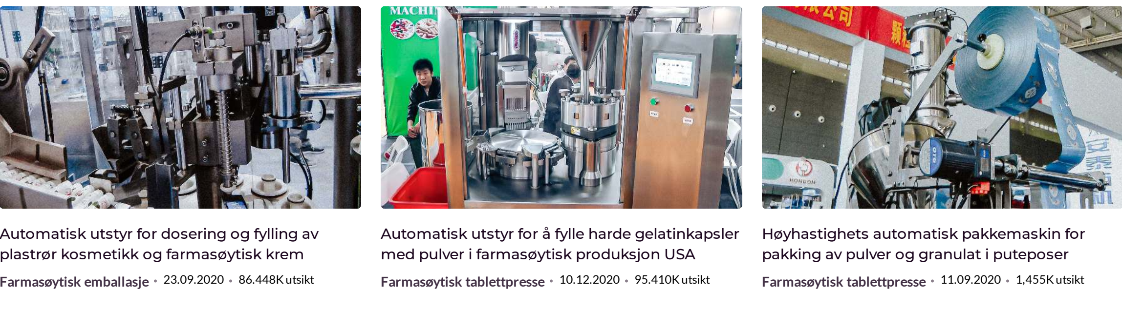
Automatisk utstyr for dosering og fylling av plastrør kosmetikk og farmasøytisk krem Farmasøytisk emballasje · 23.09.2020 · 86.448K utsikt Automatisk utstyr for å fylle harde gelatinkapsler med pulver i farmasøytisk produksjon USA Farmasøytisk tablettresse · 10.12.2020 · 95.410K utsikt Høyhastighets automatisk pakkemaskin for pakking av pulver og granulat i puteposer Farmasøytisk tablettresse · 11.09.2020 · 1,455K utsikt