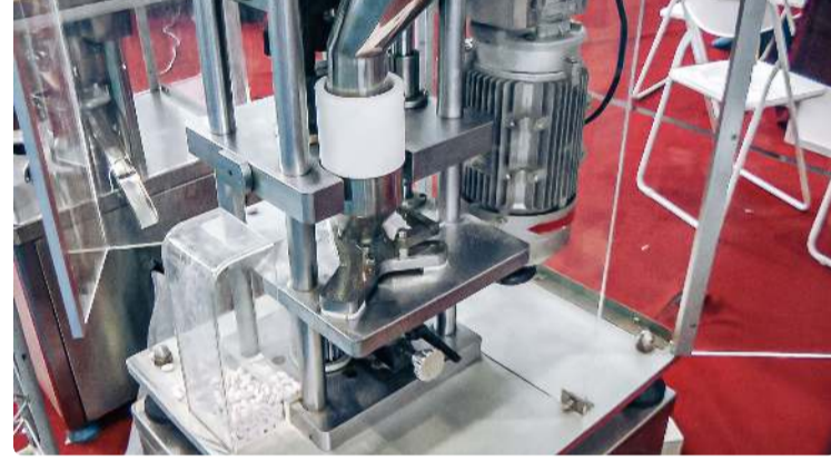
Automatisk utstyr for å lage tabletter ved bruk av nettbrettpresse i farmasøytisk produksjon Farmasøytisk tablettpresse · 02.12.2020 · 45,070K utsikt