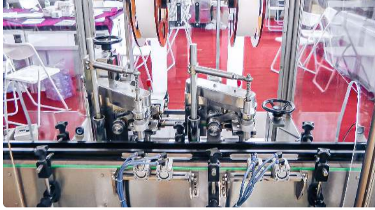
Automatisk utstyr for tilsetning av silikongel i plastflaskepose i farmasøytisk produksjon Farmasøytisk tablettpresse · 30.11.2020 · 100,545K utsikt