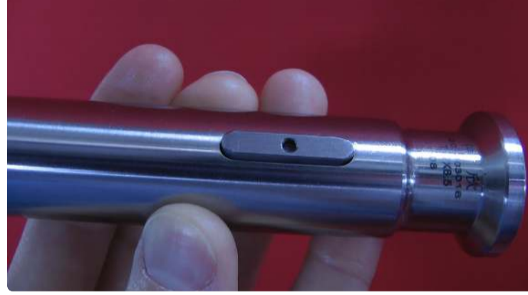
Stanser og matriser for roterende tablettresseprøver POLEN Farmsøytisk emballasje · 24.09.2020 · 88.900K utsikt