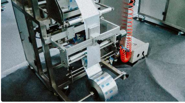
Automatisk pulverutdelingsmaskin for pakking av puteposer i plast Farmsøytisk tablettresse · 11.09.2020 · 1.220K utsikt