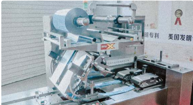
Automatisk emballasjemaskin for å pakke blemmer med piller i plastpose Farmasøytisk tablettpresse · 04.09.2020 · 2,508 k utsikt