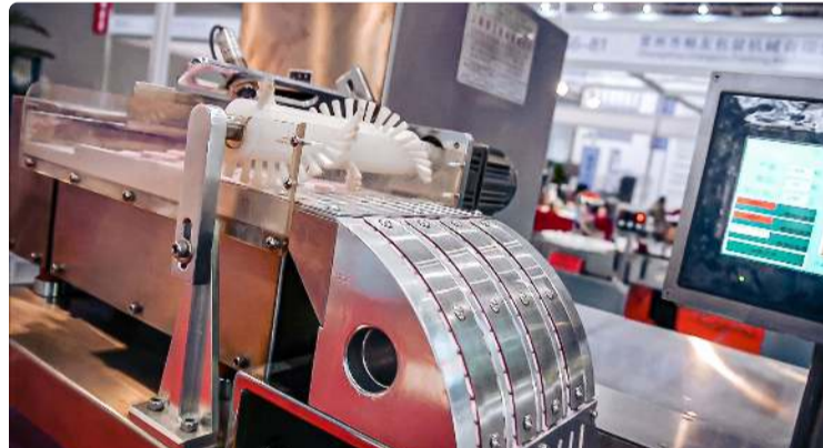
Automatisk utstyr for innpakning av nettbrett i myk aluminiumsstripeemballasje Farmasøytisk tablettpresse · 24.11.2020 · 70.070K utsikt