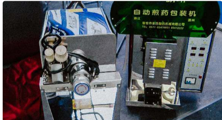
Utstyr for å kutte flis fra treet eller rotmedisinen Farmasøytisk tablettresse · 28.08.2020 · 1.507K utsikt