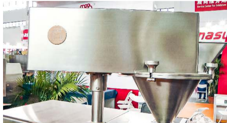
Automatisk utstyr for tørr granulering av pellets i farmasøytisk produksjon Afrika Farmasøytisk tablettresse · 08.12.2020 · 74.795K utsikt