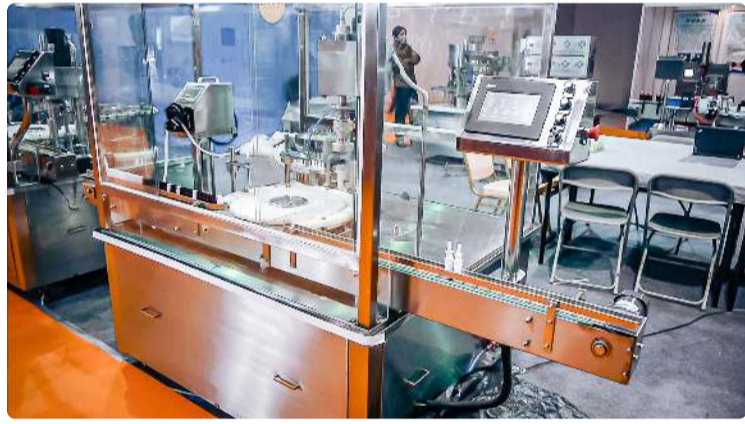
Automatisk utstyr for tapping og avdekking av plastflasker Farmasøytisk tablettresse · 24.11.2020 · 40.701K utsikt