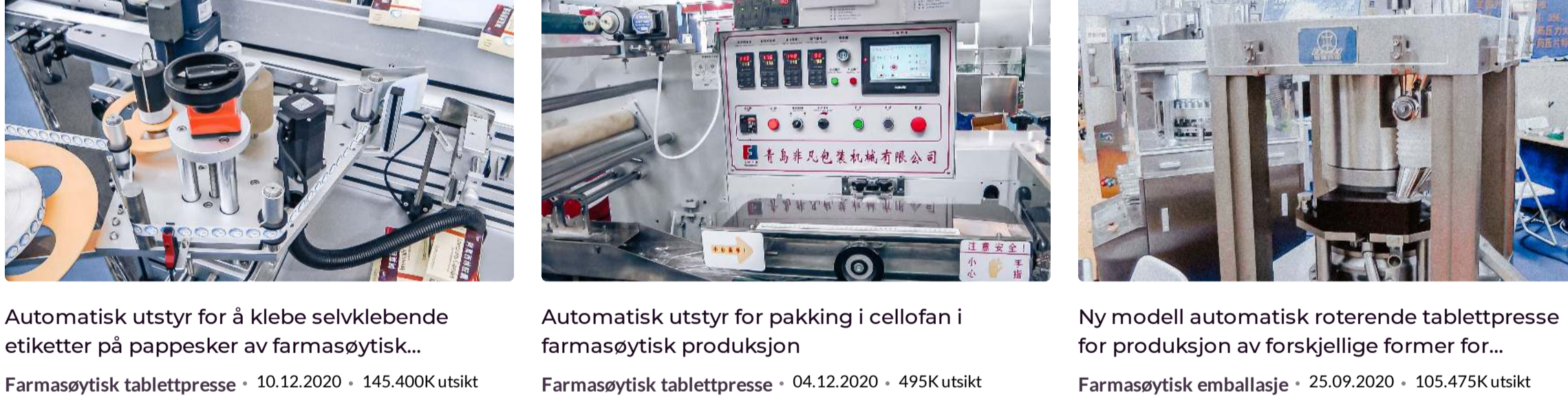
Automatisk utstyr for å klebe selvklebende etiketter på pappesker av farmasøytisk... Farmasøytisk tablettresse · 10.12.2020 · 145.400K utsikt