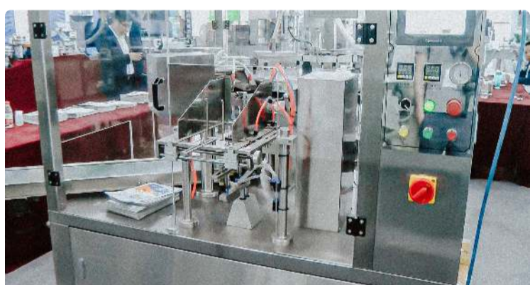
Automatisk kappemaskin for høye ustabile flasker og skruelokk Farmasøytisk tablettpresse · 11.09.2020 · 18K utsikt