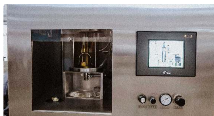
Utstyr for oljekapsel i myk gelkapsel Farmasøytisk tablettpresse · 08.09.2020 · 1,547K utsikt