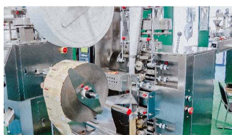
Automatisk høyhastighets pakkemaskin for pakking av te i filterpose og plastkonvullt Farmasøytisk emballasje · 24.09.2020 · 1057K utsikt