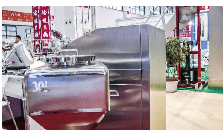
Automatisk pulverblanding av kjegleutstyr i farmasøytisk produksjon Farmasøytisk tablettresse · 24.11.2020 · 47.108K utsikt