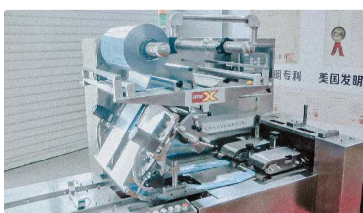
Automatisk emballasjemaskin for å pakke blemmer med piller i plastpose Farmasøytisk tablettresse · 04.09.2020 · 2.508 kutsikt