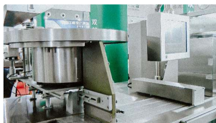
Høyhastighets automatisk blistermaskin for tabletemballasje i PVC og ALU blisterpakkinger Farmasøytisk tablettresse · 11.09.2020 · 1.777K utsikt