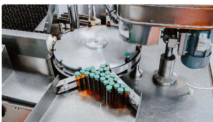
Automatisk tapping og tappemaskin aluminiumshetter penicillinflasker Farmasøytisk emballasje · 25.09.2020 · 35.800K utsikt