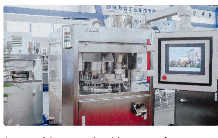
Automatisk roterende tablettpresse for farmasøytisk produksjon av tablettpressing Farmsøytisk emballasje · 16.09.2020 · 1.050K utsikt