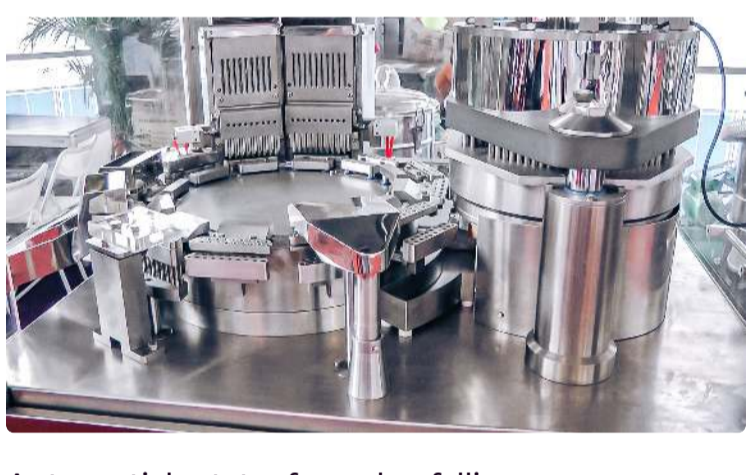
Automatisk utstyr for pulverfylling av gelatinkapsler i farmasøytisk produksjon Farmsøytisk tablettpresse · 09.12.2020 · 707K utsikt