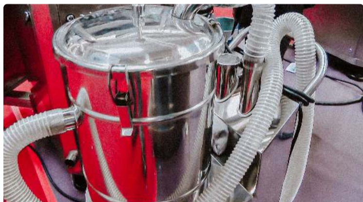
Automatisk dammborttagningsmaskin för pulver och pellets, för att arbeta med... Farmaceutisk förpackning · 15.09.2020 · 1.487K utsikt