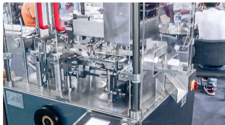
Kartongmaskin för automatisk utrustning för flaskor med preventivpillerar i farmaceutisk... Farmaceutisk tablettpress · 02.12.2020 · 77.500K utsikt