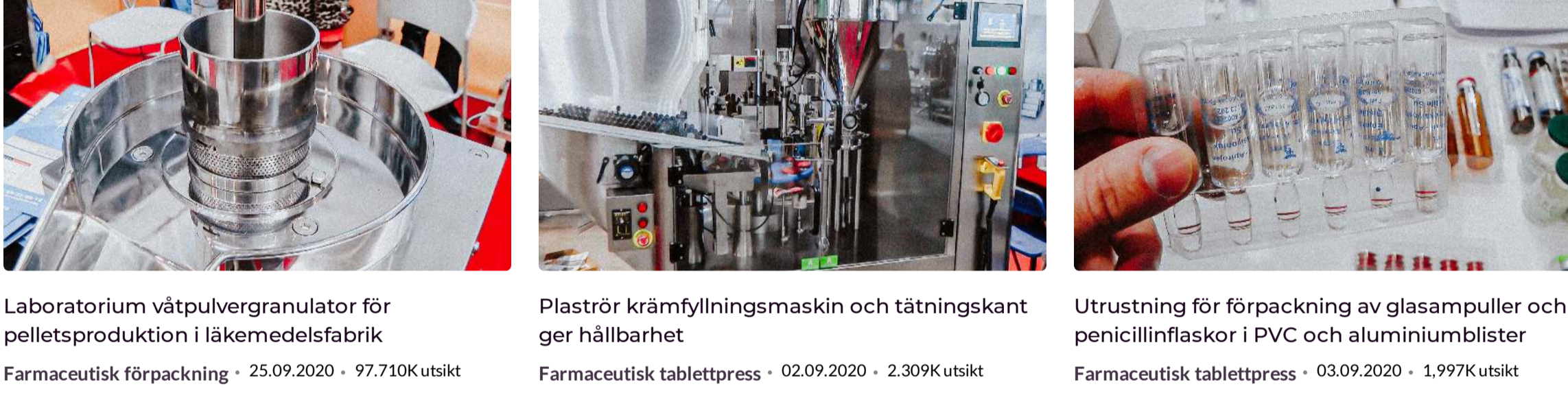
Laboratorium våtpulvergranulator för pelletsproduktion i läkemedelsfabrik Farmaceutisk förpackning · 25.09.2020 · 97.710K utsikt Plaströr krämfyllningsmaskin och tätningskant ger hållbarhet Farmaceutisk tablettpress · 02.09.2020 · 2.309K utsikt Utrustning för förpackning av glasampuller och penicillinflaskor i PVC och aluminiumblister Farmaceutisk tablettpress · 03.09.2020 · 1.997K utsikt